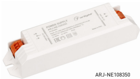
ARJ-NE108350 ARJ-NE117350 ARJ-NE135350