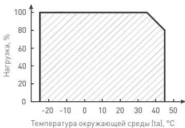
Рис. 2. Максимальная допустимая нагрузка, % от мощности источника.