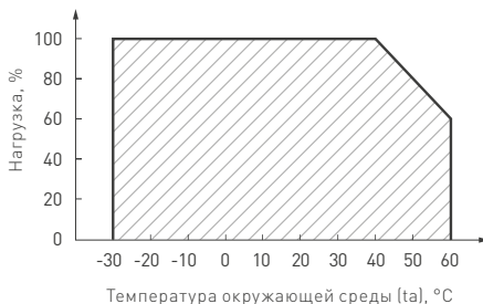
Рис. 2. Максимальная допустимая нагрузка, % от мощности источника.