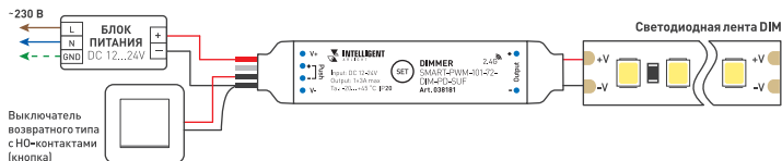
Рис. 1. Схема подключения диммера с использованием выключателя возвратного типа (кнопки)