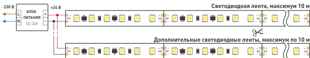
Схема подключения нескольких светодиодных лент с одной стороны.

Максимальная длина подключения ленты – 10 м (1 катушка).