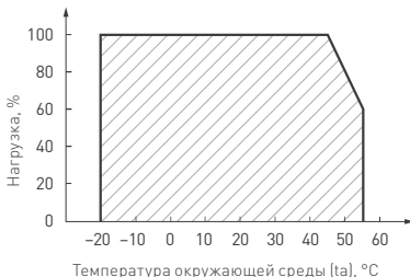
Рис. 3. Максимальная допустимая нагрузка, % от мощности источника