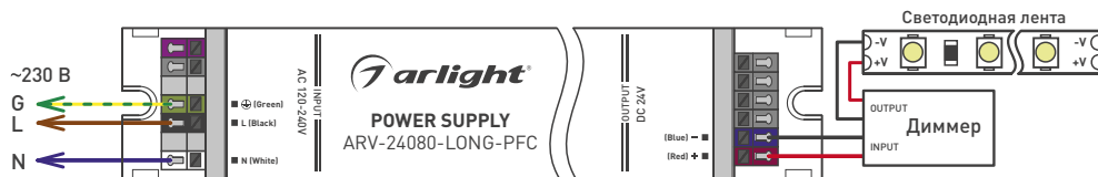
Рис.2 Схема подключения блока питания к светодиодной ленте через диммер.