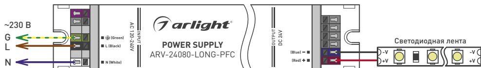
Рис.1 Схема подключения блока питания напрямую к светодиодной ленте.