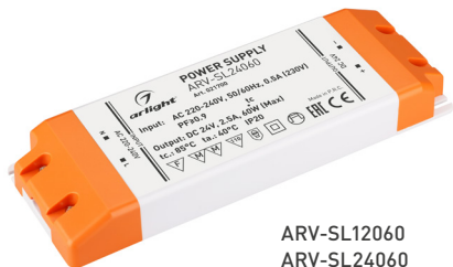
ARV-SL12060 ARV-SL24060 ARV-SN24060-PFC-C