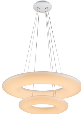
ALT-TOR-BB750PW-104W (SET 2)